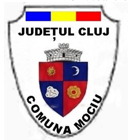
Anexa nr. 3 la HCL nr. 50/2016